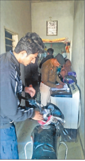
फतेहाबाद। तलाशी अभियान चलते पुलिस टीम।

पकड़ना ही नहीं, बल्कि क्षेत्रवासियों को सुरक्षा का भरोसा दिलाना और अपराध को नकेल कसना भी था। पुलिस अधिकारियों ने बताया कि इस प्रकार के नियमित तलाशी अभियान जिले में अपराध नियंत्रण और कानून-व्यवस्था बनाए रखने के लिए निरंतर चलाए जाएंगे। ऐसे अभियान से अपराधियों में डर उत्पन्न होता है और आम नागरिकों में सुरक्षा की भावना मजबूत होती है। प्रभारी निरीक्षक ने स्पष्ट किया कि रतिया और फतेहाबाद पुलिस का मकसद अपराधियों को किसी भी हाल में राहत न देना और अपराध को जड़ से खत्म करना है। उन्होंने नागरिकों से भी अपील की कि वे संदिग्ध गतिविधियों की जानकारी तुरंत पुलिस को दें।