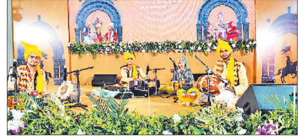
फतेहाबाद। राष्ट्रीय कला उत्सव में भाग लेते गवर्नमेंट मॉडल संस्कृति सीनियर सेकेंडरी स्कूल के विद्यार्थी।