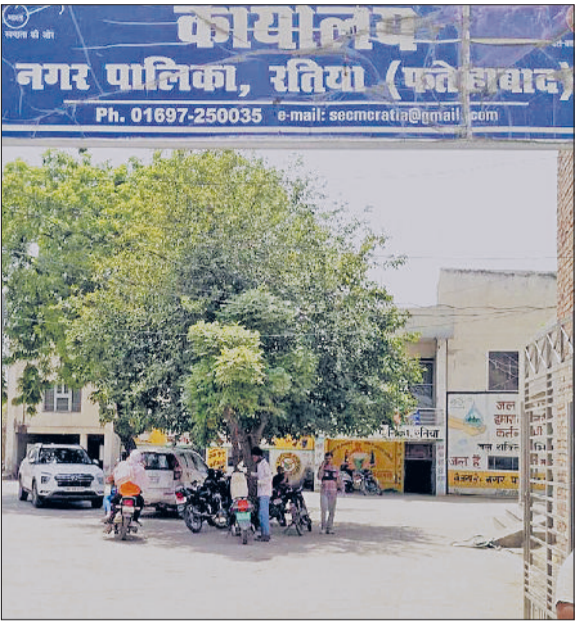
रतिया। नगरपालिका कार्यालय।