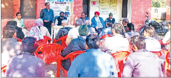
सिरसा। कार्यक्रम में उपभोक्ताओं को उनके अधिकारों के बारे विस्तार से बताते हुए।