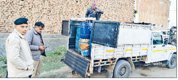
भूना। ऑटो मार्केट में अवैध तेल से भरी हुई पिकअप गाड़ी की जांच करती पुलिस।